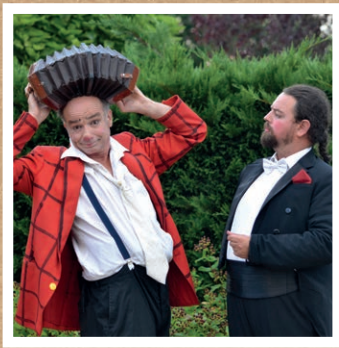
Rafistol et Maestro